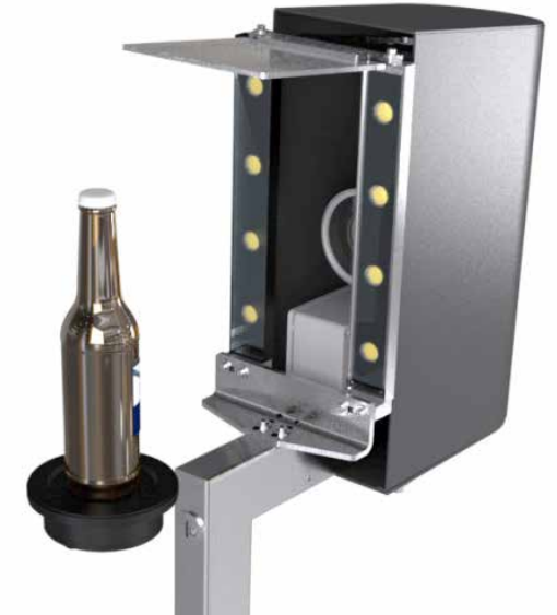
EM-Kamera in Paketen (0, 1, 2, 3)